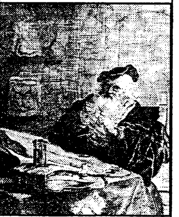
Rembrandt, Pisář, lept